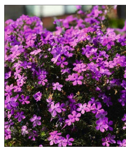
Phlox 'Summerstar Rose'.