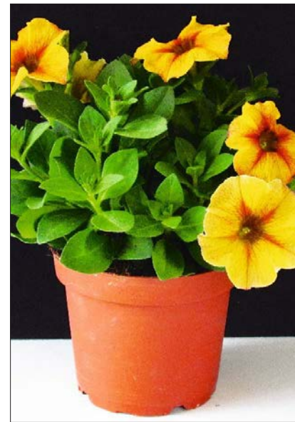
x Petchoa 'BeautiCal Carmel Yellow'.

► gem Blumenmuster die Kollektion: 'Sweet Sunset' mit kräftig orangefarbenen Zungenblüten und dunkler Mitte sowie 'Sweet Fiesta' mit halbgefüllten Blumen in kräftigem Pink mit weiß auslaufendem Rand. Weiterhin kommt eine weiße Sorte hinzu. Im Versandhandel werden die Sorten oft als winterhart beschrieben. Dies trifft jedoch auf unsere Breitengrade nicht zu. Selbst am Standort Veitshöchheim (Weinbauklima mit milden Wintern) überlebte keine Sorte den Winterhärte-test.