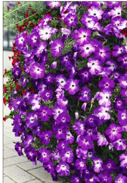
Petunia 'FP Select Twirl Blue'.