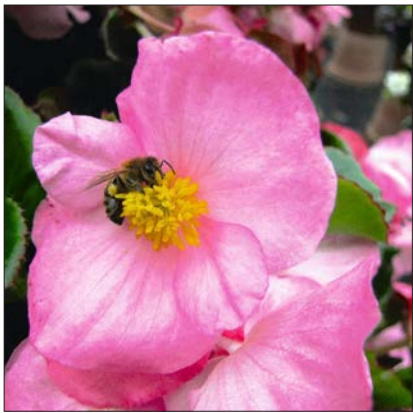
Begonia 'Tophat Pink'.