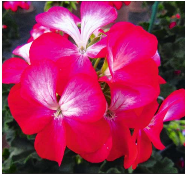
Pelargonium zonale 'Bunny Cherry Ice'.