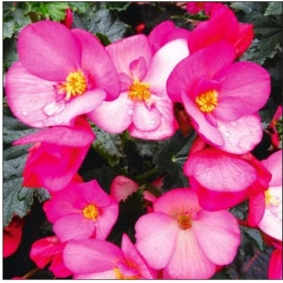
Begonia-Elatior 'BEEL 3635'.