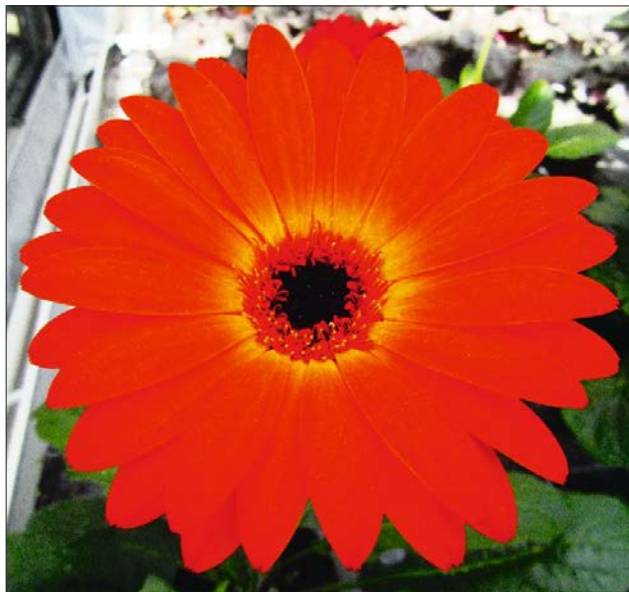
Gerbera 'Sweet Sunset'.