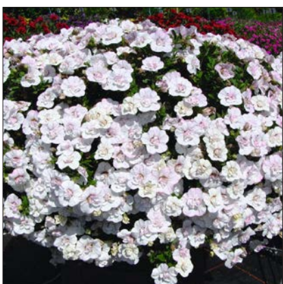
Calibrachoa 'Uno Double White Pink Vein'.