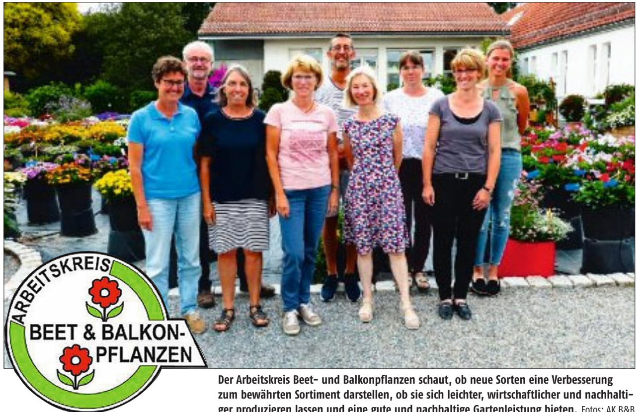
Der Arbeitskreis Beet- und Balkonpflanzen schaut, ob neue Sorten eine Verbesserung zum bewährten Sortiment darstellen, ob sie sich leichter, wirtschaftlicher und nachhaltiger produzieren lassen und eine gute und nachhaltige Gartenleistung bieten.

Vom Typ her ähnelt die Serie den bereits bekannten Serien „Big“ oder „Megawatt“, jedoch mit noch etwas größeren