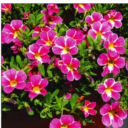
Calibrachoa 'Pink Starburst'.

Im diesjährigen Prüffahr stand beim Arbeitskreis Beet- und Balkonpflanzen besonders die Bewertung der Stabilität neuer Sorten gegen starke Einstrahlung, Hitze und Trockenheit im Fokus