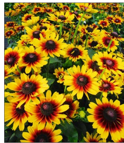
Rudbeckia 'SmileyZ Laughing'.