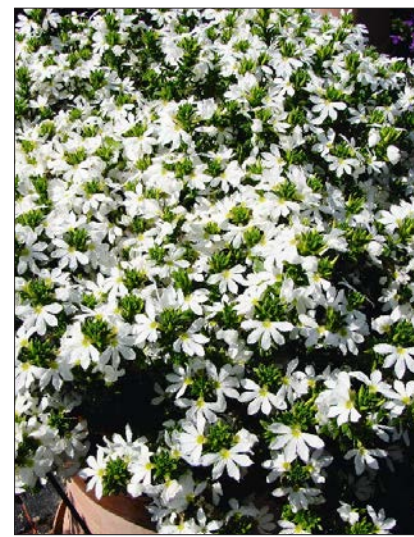
Scaevola-Testsorte 'Surdiva Early White'.